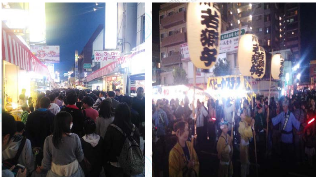
图为 10 月川越祭